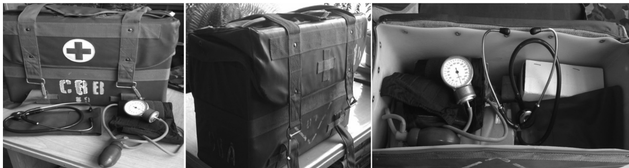
Рис. 3. Штатные полевые наборы и комплекты, находящиеся на снабжении военно-медицинской службы и содержащие аппараты для аускультативного измерения АД