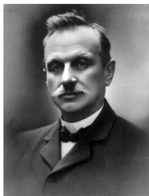
Рис. 1. Шипионе Рива-Роччи (1863–1937)