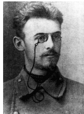
Рис. 2. Н. С. Коротков (1874–1920)