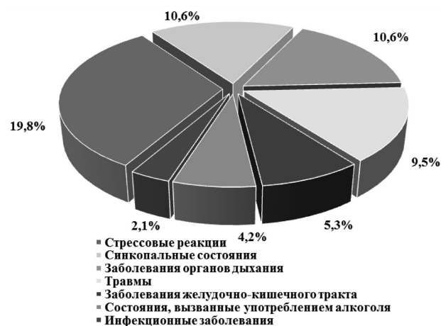
Рис. 2. Структура причин вызовов медицинских работников на борт воздушного судна в Республике Беларусь в 2017 году [Отчет о работе ГУ «Медицинская служба гражданской авиации» за 2017 год]

Дежурная смена здравпункта ГУ «Медицинская служба гражданской авиации», расположенного на территории РУП «Национальный аэропорт Минск», для оказания медицинской помощи пассажирам вызывалась на борт воздушного судна 106 раз.