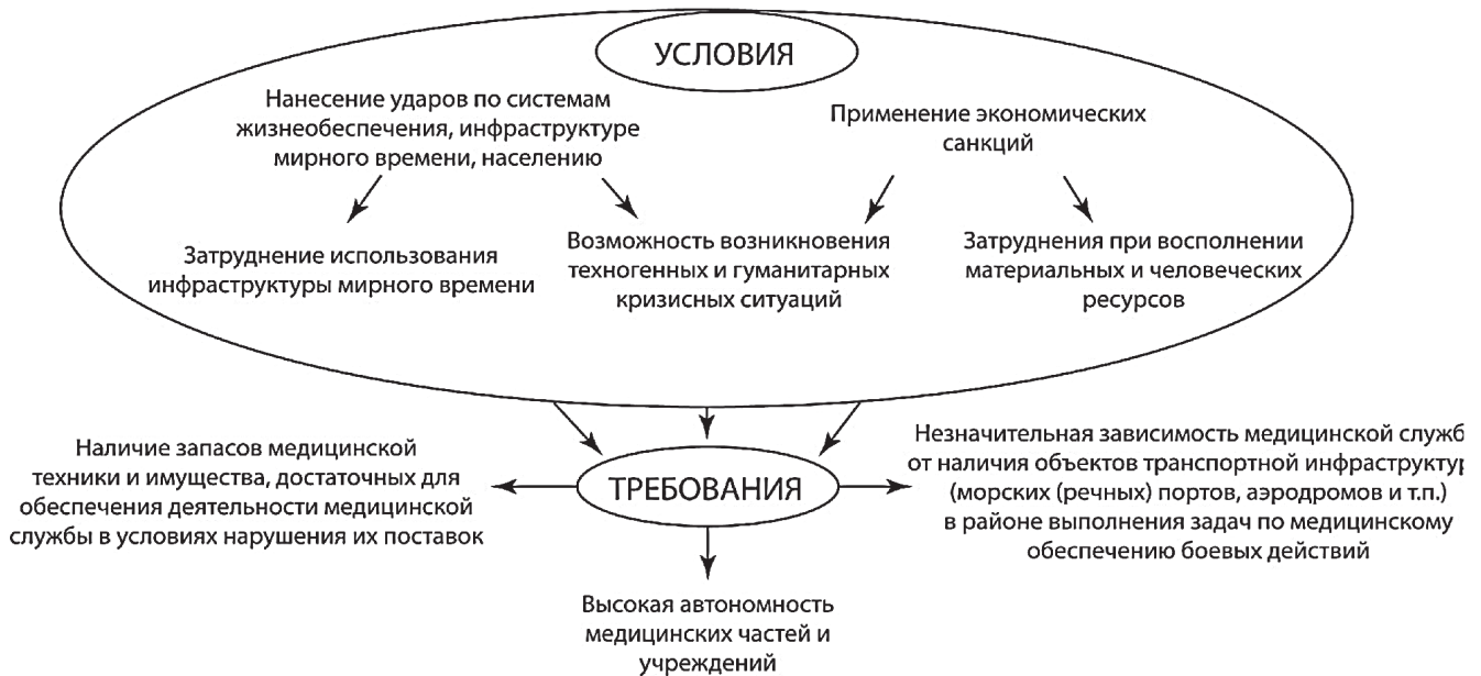
Рис. 2. Условия деятельности системы медицинского обеспечения боевых действий, возникающие в результате комплексного применения военной силы и средств невоенного характера

ки новых принципов её использования, а также повышения эффективности систем разведки и управления.