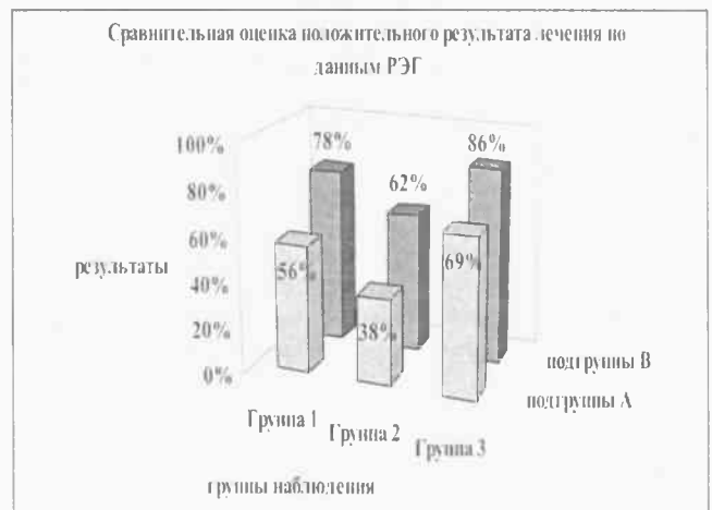
Рис. 2. Сравнительная оценка достигнутого положительного результата лечения по данным показателя РЭГ в наблюдаемых подгруппах больных с травматическим невритом III ветви тройничного нерва

Пациенты подгрупп 1А, 2А, 3А (18, 8 и 16 больных, соответственно) получали только стандартную схему лечения. Подгруппам 1В, 2В, 3В (18, 8 и 14 пациентов, соответственно) параллельно со стандартным лечением проводили курс Диа-ДЭНС-терапии. Рефлексотерапевтическое воздействие осуществляли при помощи аппарата диадинамической чрезкожной электронейростимуляции Диа-ДЭНС-DT. Для воздействия были определены каналы тела человека, входящие в интересующую нас зону: толстой кишки (GI), желудка (E), тонкой кишки (IG), желчного пузыря (VB), переднесрединный канал (VC). На указанных каналах использовали акупунктурные точки общего действия: GI4, GI10, GI11, VB20, VG26; локальные акупунктурные точки (в зависимости от локализации поражения): GI18, E3, E4, E5, E6, E7, IG16, IG17, IG18, IG19, VB1, VB2, VB3, VC24. Применяли отдаленные АТ, расположенные на вышеуказанных меридианах. Курс состоял 10 сеансов, выполняемых ежедневно или через день. Каждый сеанс общей продолжительностью от 30 до 40 минут (в зависимости от числа задействованных акупунктурных точек). Раздражение осуществляли в накожной проек-