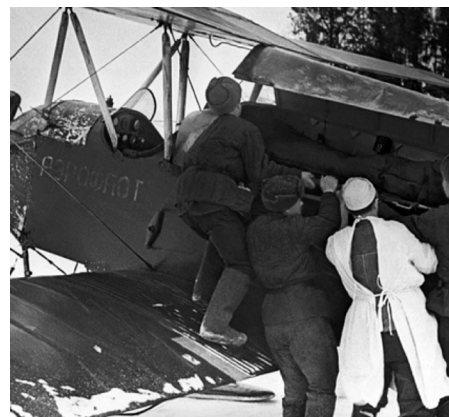
Фото 2. Погрузка раненых в санитарный самолет С-3