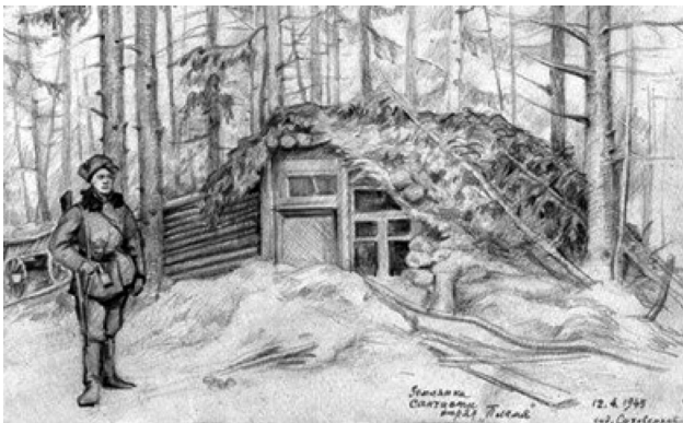
Рис. 2. Землянка санчасти. Рис. У. П. Суховерхова, 1943 г.

Это взаимодействие имело своей целью оказание помощи медицинской службе партизанских соединений посредством ее усиления медицинским персоналом и путем снабжения медицинским имуществом, лекарственными средствами и что очень важно эвакуация на «Большую землю» санитарной авиацией тяжело раненых и тяжелобольных, нуждающихся в специализированном лечении в условиях крупных специализированных учреждений военного и гражданского ведомств (фото 2).