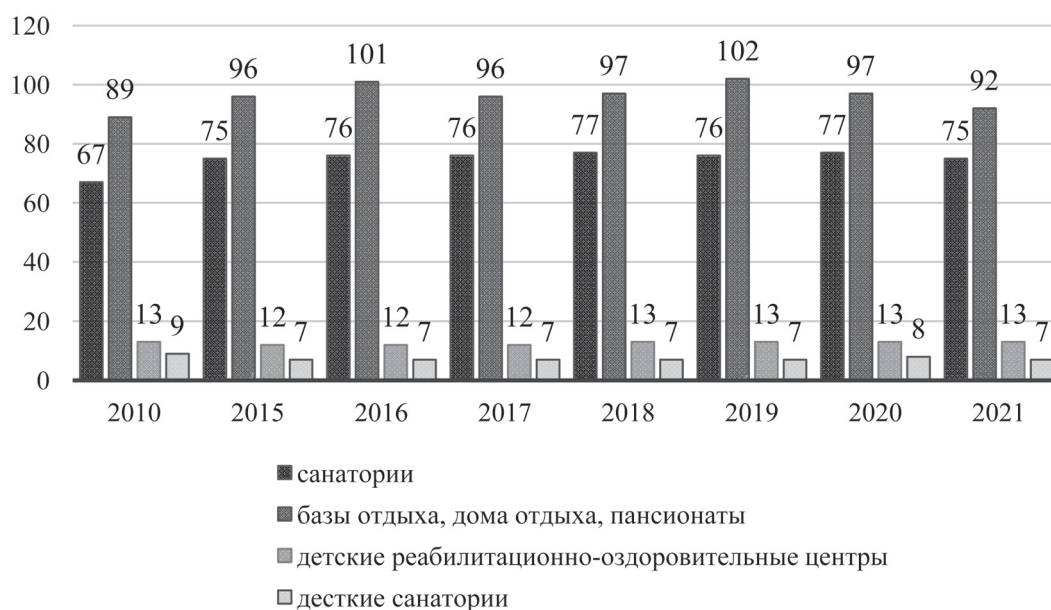
Рис. 3. Динамика количества санаторно-курортных организаций

Разработана адаптированная применительно к санаторно-курортному оздоровлению и лечению базовая модель оценки, которая включает в себя природно-лечебную, медицинскую, социокультурную составляющие, выступающие в роли оздоравливающих факторов. Между данными составляющими существуют как внутренние, так и внешние связи, которые оказывают влияние на формирование состояния данной сферы, информированность и степень удовлетворенности услугами санаторно-курортного лечения населения.