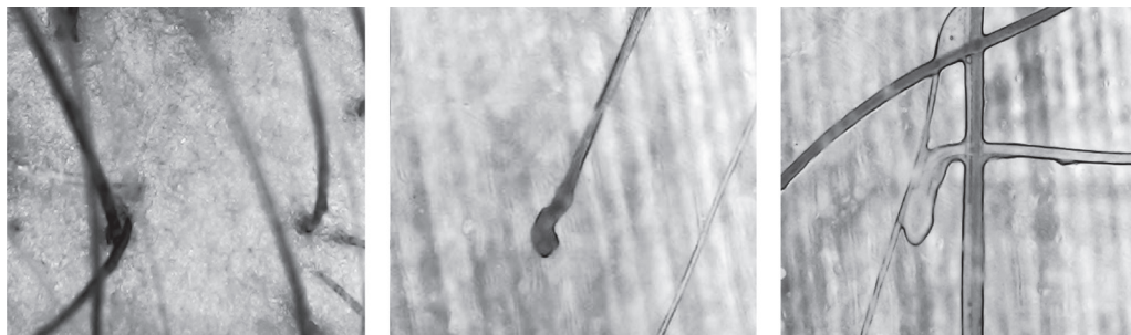
Рис. 1. Фототрихограмма луковицы волоса до лечения

крови на гормоны) и трихологические методы исследования (фототрихограмма, пул-тест, микроскопия корня волоса). Выполнена трихоскопия с трихограммой для подтверждения диагноза диффузного телогенового выпадения волос и дифференциальной диагностики с другими видами выпадения волос. Нами был выявлен основной трихоскопический признак – наличие волос в фазе телогена более 10%. При лабораторных исследованиях крови по уровню ферритина установлен признак латентного дефицита железа. Пациентка предъявляла жалобы на повышенное выпадение волос без положительной динамики от проводимого лечения.