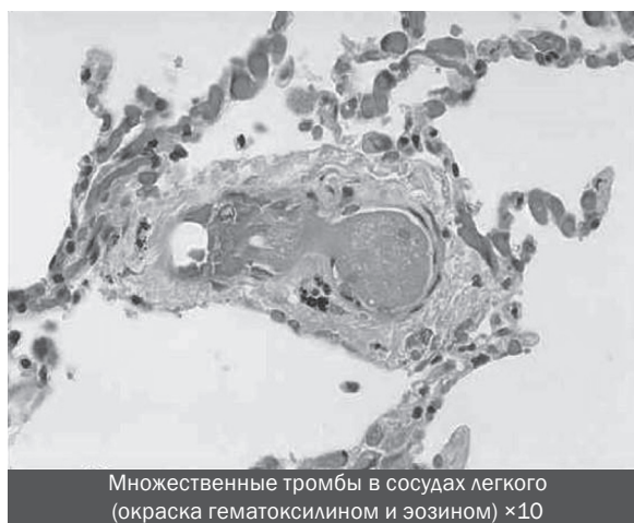
Множественные тромбы в сосудах легкого (окраска гематоксилином и эозином) ×10

Из представленного следует, что лечебными способами предотвращения смерти у пациентов тяжёлыми коронавирусными пневмониями, устраняющими патогенетические изменения, могут быть следующие: а) применить антигипоксанты (Неотон или Реамберин) внутривенно – для недопущения наступления гипоксиягеной системной деструкции тканей и последующей, в связи с этим, полиорганной декомпенсации с летальным исходом [2]; б) применить тромболитическую терапию (фибринолизин или ретаплаза) – для ликвидации уже образовавшихся тромбов в МЦР, блокирующих гемоглобин зависимый путь доставки кислорода тканям (усугубляющего системную гипоксию тканей); в) применить альтернативное, не транспульмональное (кислород