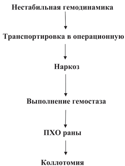
Рис. 3. Алгоритм диагностических и лечебных мероприятий при ранениях шеи в случае нестабильной гемодинамики

когда гемодинамика стабилизируется, проводится ПХО раны, после чего в качестве операционного доступа применяется коллотомия, а в дальнейшем все зависит от ситуации. Алгоритм представлен на рисунке 3. Здесь, мы считаем, необходимо выделить несколько факторов. Первое, независимо от состояния раненого в момент поступления требуется адекватное обезболивание с применением ненаркотических или наркотических анальгетиков, в зависимости от выраженности болевого синдрома для профилактики болевого шока. Второе, выполнение современного, адекватного и надежного гемостаза, что позволит снизить риск развития геморрагического шока, при необходимости применить тактику Damage Control. Третьим, немаловажным, фактом является предо-