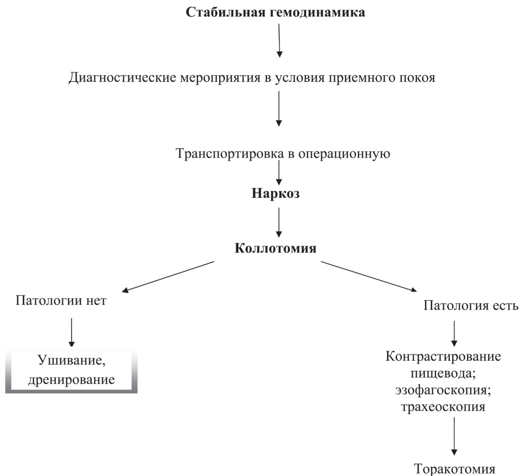
Рис. 2. Алгоритм диагностических и лечебных мероприятий при ранениях шеи при стабильной гемодинамике