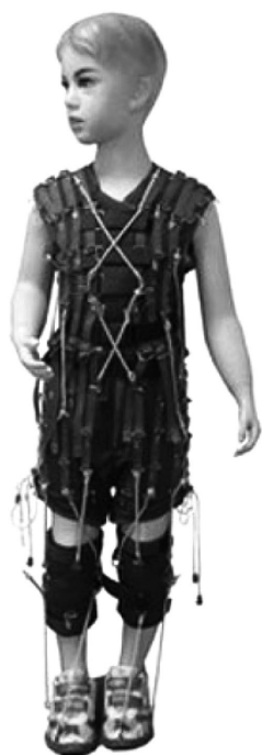
Рис. 2. Тренировочно-нагрузочный костюм «АДЕЛИ»*

* https://ortomedtehnika.ru/product/lechebnyy_kostyum_adeli