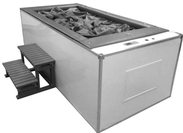
Рис. 7. Аппарат «сухой» иммерсии*

* Центр авиакосмической медицины. «Сухая» иммерсия – невесомость по рецепту [электронный ресурс]. – Режим доступа: http://amc-si.com/sukhaya-immersiya . – Дата доступа: 2007.