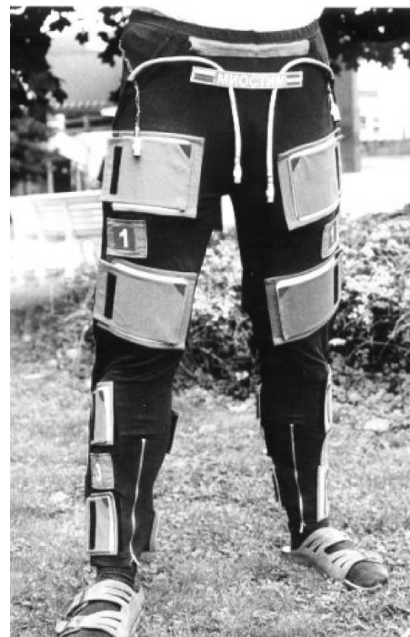
Рис. 4. Электромиостимулятор «МИОСТИМ»*

* http://amc-si.com/tovari-i-uslugi/lechebnyy-kostium-regent