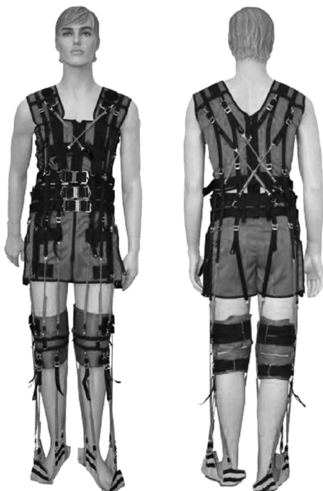
Рис. 3. Лечебный костюм «РЕГЕНТ»*

* https://ortomedtehnika.ru/product/lechebnyy_kostyum_adeli