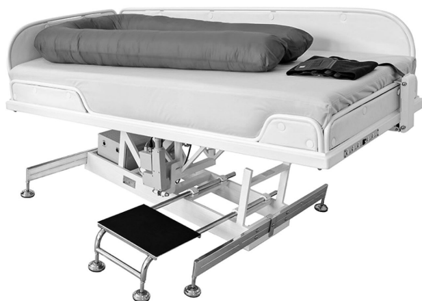
Рис. 8. Стол инверсионный для лечебного воздействия на пациента*

* Центр авиакосмической медицины. «Сухая» иммерсия – невесомость по рецепту [электронный ресурс]. – Режим доступа: http://amc-si.com/sukhaya-immersiya . – Дата доступа: 2007.