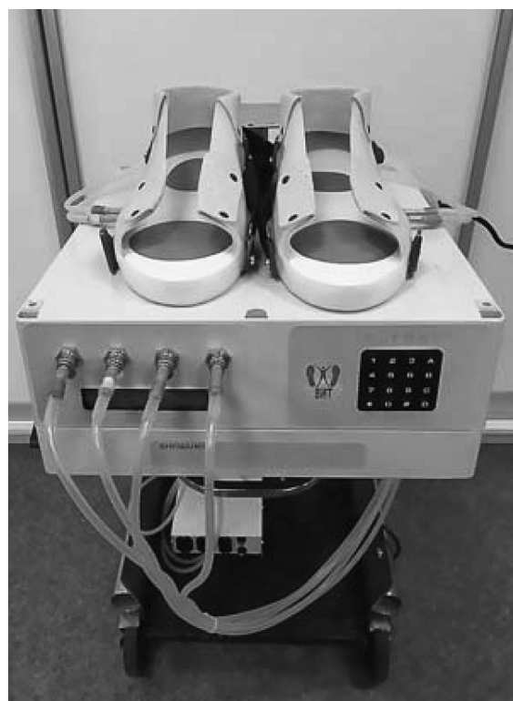
Рис. 1. Устройство «КОРВИТ»*

У взрослых пациентов приоритетным направлением для использования данной мето-