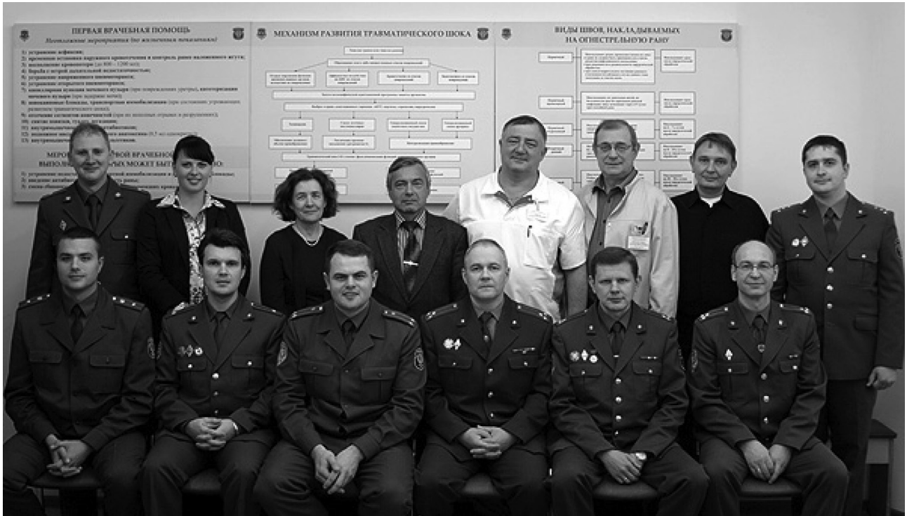
Кафедра военно-полевой хирургии. 2015 год