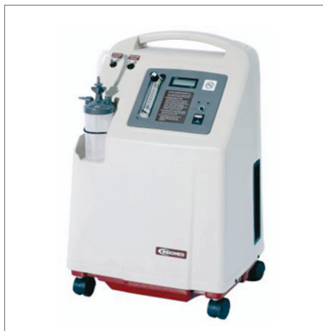
Рисунок 4. Концентратор кислорода Armed 7F-5L

ные системы для неинвазивной, контролируемой вентиляции легких с непрерывной адаптацией к дыханию пациента (рис.4). Системы осуществляют функцию самостоятельного анализа типа дыхания пациента и настройки режима вентиляции в рамках предварительного заданного диапазона, улучшает качество жизни пациентов с хронически ослабленной дыхательной мускулатурой. Оптимальная синхронизация дыхания пациента и работы аппарата позволяет пациенту практически минимизировать дыхательные усилия. Среди поставляемых в СНГ аппаратов известны модели аппаратов Weinmann, Armed, которые отвечают требованиям неинвазивной вентиляции легких и имеют уникальный режим вентиляции Timed-Adaptive, обеспечивая наилучшую помощь в разгрузке дыхательной мускулатуры пациента.