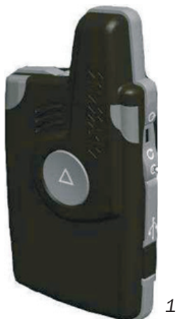
Рисунок 1. Внешний вид устройства.