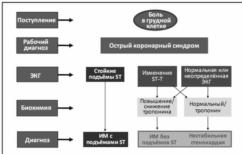
Схема 1. Спектр острых коронарных синдромов (ЕНЖ 2011)