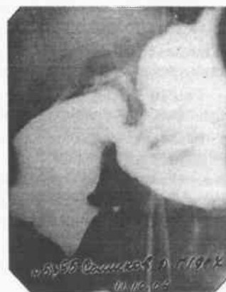
Рис. 3. В ниже-горизонтальной части определяется линейная компрессия кишки артериомезентериальными сосудами