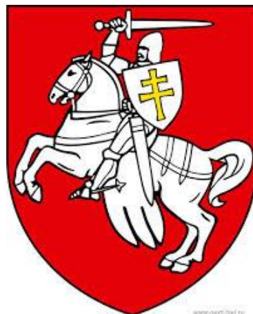
«Погоня» — герб ВКЛ, государственный герб Республики Беларусь в 1991–1995 гг.

Достижением того времени стала разработка и принятие Статута ВКЛ — книги судебных законов в трёх редакциях 1529, 1566, 1588 гг. Статут 1588 г., подготовленный при участии Льва Сапегу , действовал в Беларуси до 1840 г. Он включал в себя нормы государственного, административного, уголовного, трудового, семейного и, впервые в мире, эко-