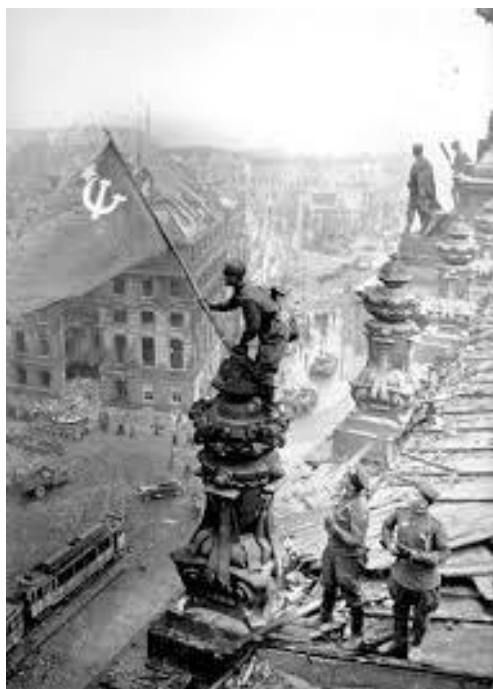
Красный флаг над Рейхстагом

Для освобождения Беларуси советское командование разработало специальную операцию « Багратион ». Она предусматривала одновременное наступление Красной армии на севере под Витебском и юге в направлении Бобруйска. Такой план не позволял немцам перебрасывать свои войска на помощь. Операция началась 23 июня 1944 г. , ровно через 3 года после нападения немцев на Советский Союз. Это была одна из самых крупных военных операций во Второй мировой войне. В освобождении республики принимали участие четыре советских фронта: 1-й Белорусский (командующий К. Рокоссовский), 2-й Белорусский (командующий Г. Захаров), 3-й Белорусский (командующий И. Черняховский) и 1-й Прибалтийский (командующий И. Баграмян). Войска этих фронтов насчитывали 2,4 млн человек, 36 400 орудий и миномётов, 5200 танков и 5300 самолётов. Наступление было очень стремительным. Активную помощь наступающим войскам Красной Армии оказывали партизаны. Они разрушали коммуникации немецких войск, затрудняя этим передвижение войск