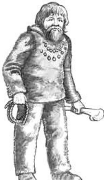
Житель Древней Беларуси

1. Древнее население на территории Беларуси. Первые люди на землях современной Беларуси, в историческом плане, появились достаточно поздно. Обусловлено это тем, что территория республики долгое время была покрыта ледником . В период временных потеплений на протяжении древнего каменного века (палеолита) на юге Беларуси появлялись первые поселенцы . Подтверждением этому являются древнейшие орудия труда. По данным археологии, люди могли их использовать 100–35 тыс. лет тому назад .