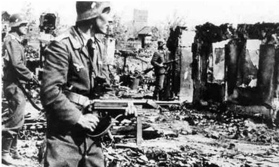
Немецкие захватчики на территории оккупированной Беларуси

Вместе с тем оккупированные земли немецкие власти стремились максимально использовать для нужд Германии. На оставшихся фабриках и заводах немцы налаживали выпуск необходимой для их армии продукции. Рабочий день там продолжался в среднем по 12–16 часов. Зарплата была маленькой. На неё было очень трудно прокормить семью. Население городов переселялось в сельскую местность. Крестьяне в деревне вынуждены были выплачивать немцам налог зерном, мясом, яйцами и другими продуктами, выполнять разного рода работы. Молодых девушек и юношей вывозили в Германию на работу. Из Беларуси, в частности, было вывезено около 400 тыс. человек.