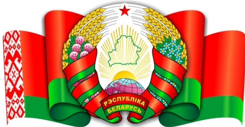
Флаг и герб Республики Беларусь

С распадом СССР был принят ряд законов, которые юридически оформляли независимость Беларуси. 25 августа 1991 г. Верховный Совет БССР (в то время так назывался белорусский парламент) объявил законом принятую 27 июля 1990 г. Декларацию о государственном суверенитете. Этим законом суверенитет и независимость Беларуси были оформлены законодательно. На этой же сессии Верховного Совета была приостановлена деятельность Коммунистической партии Беларуси. 26 августа 1991 г. был принят Закон «Об обеспечении политической и экономической самостоятельности БССР», а 19 сентября 1991 г. — закон об изменении названия республики. Вместо БССР она стала называться «Республика Беларусь». Была утверждена новая государственная символика: герб «Погоня» и бело-красно-белый флаг. Белорусский язык объявлялся государственным. Однако 14 мая 1995 г. , после прихода к власти А. Г. Лукашенко, по результатам проведённого референдума были утверждены новые герб и флаг (ныне существующие), а русский язык получил статус равного с белорусским.