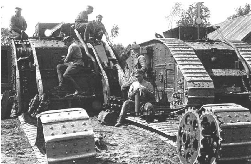
Танки Первой мировой войны

4. Первая мировая война и ее последствия для белорусских земель. Первая мировая война явилась очередной катастрофой для белорусского народа, в которую он был вовлечён не по своей воле. Будучи в составе России, которая участвовала в войне, Беларусь испытала все её тяготы.