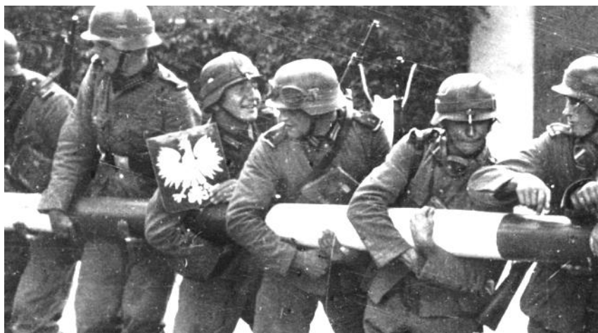
Ликвидация границы Польши немецкими солдатами в 1939 г.

Обостряло противоречия и неправильное установление границ между новыми государствами, которые появились после Первой мировой войны. Новые границы устанавливались без учета национального состава населения, исторического прошлого этих стран. Например, в состав Румынии включались земли, на которых большинство населения составляли венгры, Чехословакии — немцы, Польши — белорусы, украинцы и т. д.