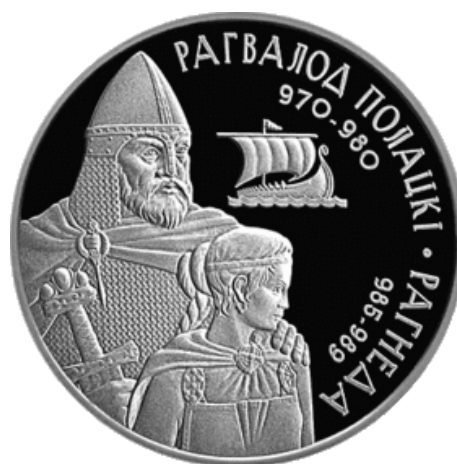
Юбилейная монета, выпущенная в Беларуси, с изображением Рогволода и Рогнеды

Первым известным полоцким князем был Рогволод , который правил во второй половине X в. В это время шла ожесточённая война между сыновьями киевского князя Святослава — киевским князем Яро-