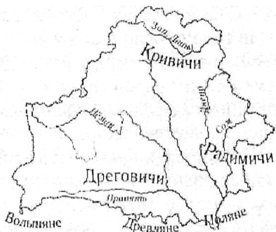
Места расселения кривичей, дреговичей, радимичей

Древние балты на протяжении бронзового и железного веков жили на южном побережье Балтийского моря, а также на большей части территории современной Беларуси. В VI в. н. э. на белорусские земли стали проникать славяне . Все эти народы (угро-финны, балты, славяне и др.) в той или иной степени передавали друг другу некоторые черты своей материальной и духовной культуры и антропологических особенностей. В результате взаимодействия преимущественно балтских и славянских