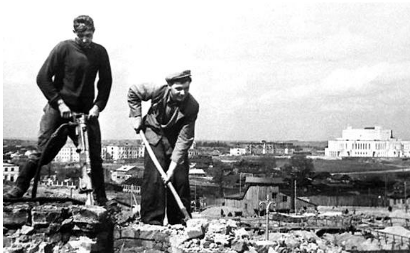
Восстановление разрушенного Минска

ходимых для продолжения войны. После окончания войны возобновляли работу не только ранее существовавшие заводы и фабрики, но и строились новые, создавались новые отрасли производства — автомобилестроение и тракторостроение, радиоэлектроника, химическое производство и другие. Одновременно с восстановлением проходила модернизация производства, на предприятиях внедрялась новая техника, оборудование. В результате к 1950 г. начало работать и было построено около 6 тыс. новых предприятий, а промышленное производство Беларуси превысило довоенный уровень на 15 %. Отставало развитие сельского хозяйства: сказывались недостаток рабочих рук (в деревнях оставались в основном женщины, старики, а мужчины были в армии, многие погибли на войне), нехватка тракторов, комбайнов, автомашин, другой техники, коней, хороших семян для посевов.