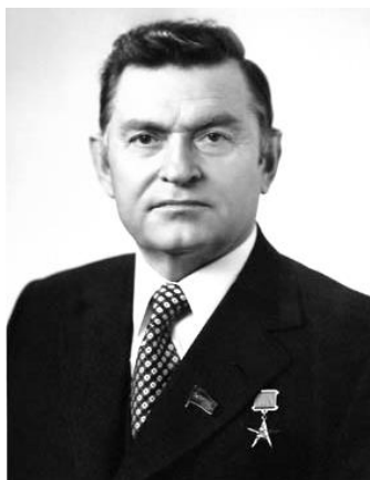
К. Т. Мазуров

4. Экономическое развитие БССР во второй половине 1950-х – первой половине 1980-х гг. В 1950–1960 гг. в Беларуси и в целом в СССР для увеличения производства и насыщения рынка товарами осуществлялось освоение целины, мелиорация , предпринимались попытки проведения экономических реформ. Предприятия получают бóльшую самостоятельность, шире используют экономические рычаги хозяйствования. С середины 1950-х гг. разворачивается научно-техническая революция, достижения науки стали активно вводиться в производство. Модернизируются предприятия, растёт промышленное производство, разворачивается интенсивное жилищное строительство. В сельском хозяйстве строятся крупные животноводческие комплексы. Промышленность Беларуси начала обеспечивать целые регионы СССР изделиями машиностроения, продуктами питания. Значительный вклад в экономическое и социальное развитие Беларуси внесли видные коммунистические деятели, белорусы К. Т. Мазуров и П. М. Машеров .