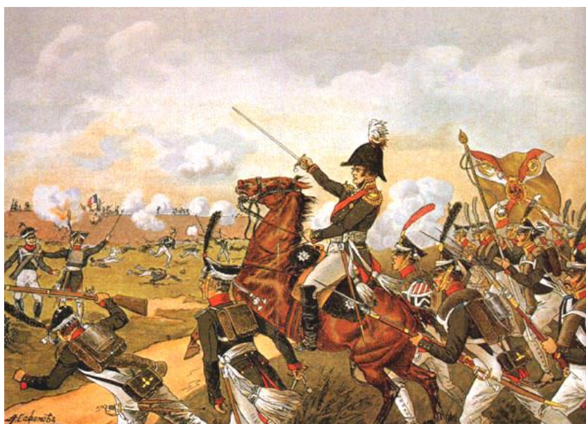
Война 1812 г.

3. Беларусь в войне 1812 г. Общественно-политическое движение в Беларуси в XIX – нач. XX в. Противоречия между буржуазной Францией и феодальной Россией в начале XIX в. привели эти государства к войне. 12 июня 1812 г. 600-тысячная армия императора Франции Наполеона I, в которой было 120 тыс. поляков, перешла реку Неман и вторглась на территорию Беларуси. Наполеон накануне войны пообещал возродить Речь Посполитую в границах 1772 г., что обеспечило ему поддержку значительной части местной шляхты. Для пополнения армии Наполеона на территории Беларуси были созданы четыре полка кавалерии, пять полков пехоты, гвардейский уланский полк.