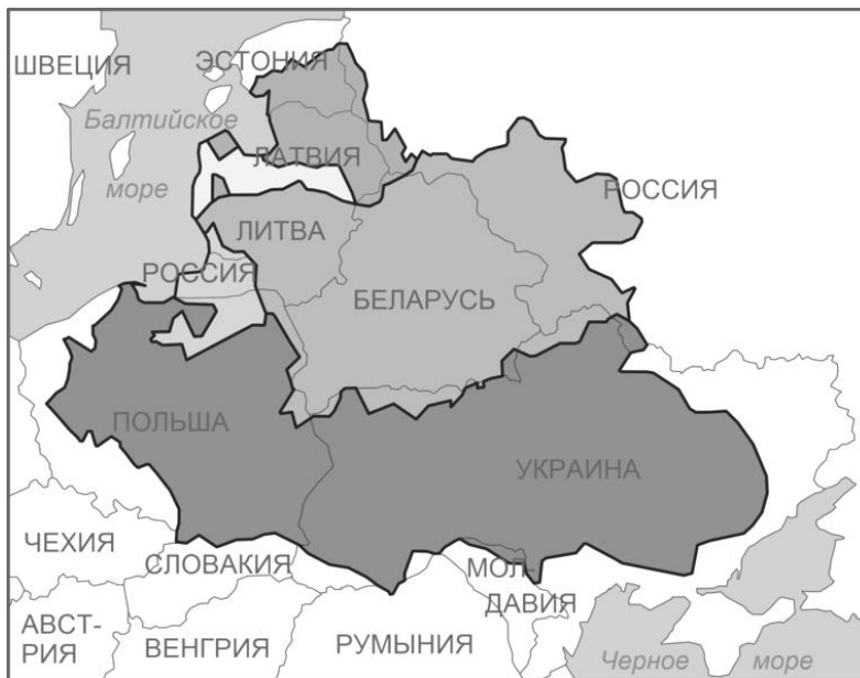
Территория Речи Посполитой (1618 г.) в соотношении с границами современных государств

косновенности имущества и личности шляхтича, согласно которому монарх и другие лица не имели права забрать у шляхтича имущество, наказать его без решения суда; право шляхты избирать на местах (в поветах) судей и должностных лиц; право контролировать деятельность монарха и высших государственных чиновников; право создавать военные союзы для защиты своих прав.