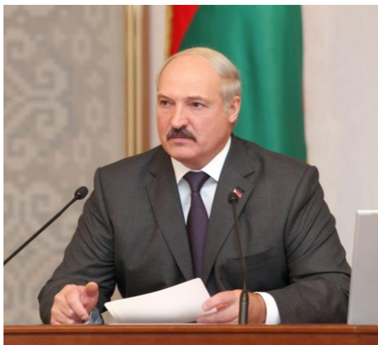
А. Г. Лукашенко

15 марта 1994 г. Верховный Совет принял Конституцию суверенной независимой Республики Беларусь. Конституция — это основной закон государства. Её принятием был закреплён государственный суверенитет и независимость Беларуси. В соответствии с новой Конституцией 10 июля 1994 г. Президентом Республики Беларусь был избран А. Г. Лукашенко.