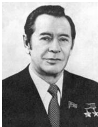
П. М. Машеров

С первой половины 1970-х гг. и особенно в 1980-е гг. в экономике Советского Союза начинают проявляться негативные процессы, которые сказываются и на развитии Беларуси. Усиливаются командно-админи-