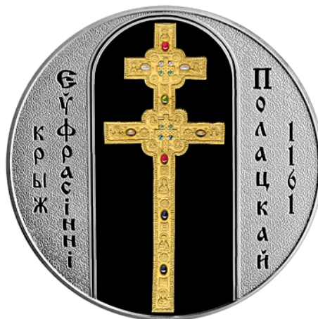
Монета, выпущенная в Беларуси с изображением креста Евфросинии Полоцкой

Особый вклад в распространение христианства, развитие культуры и письменности на белорусских землях внесла княгиня Евфросиния Полоцкая (около 1104–1167). Будучи монахиней, она строила храмы, монастыри, создавала школы, скриптории (места, где переписывались книги). Под её руководством мастером Лазарем Богшей была изготовлена национальная святыня белорусского народа — крест Евфросинии Полоцкой.