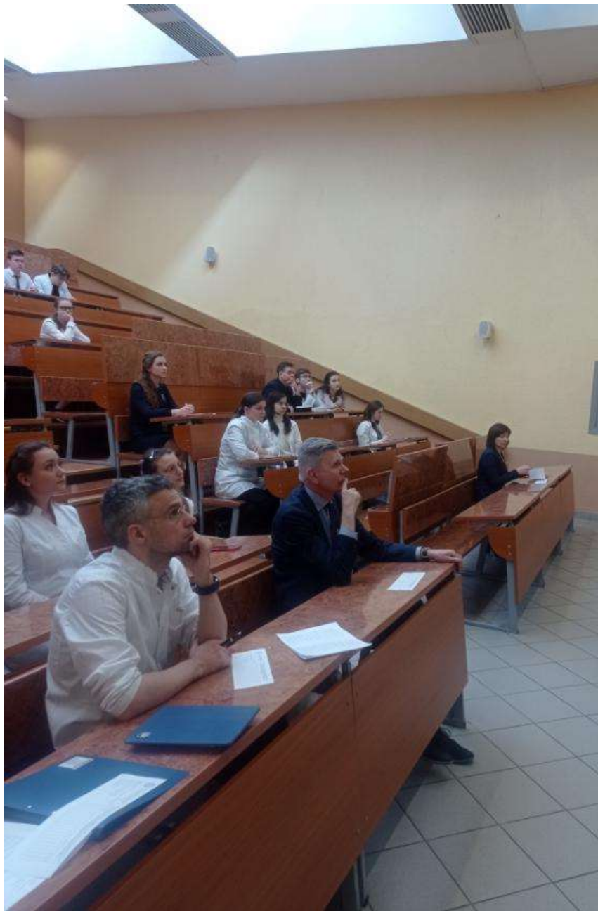
Жюри и участники 1-й секции