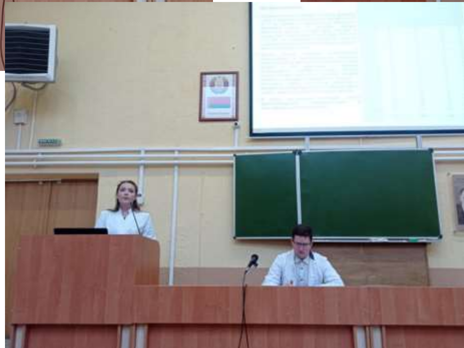
Кружковцы кафедры нормальной анатомии БГМУ со своими докладами