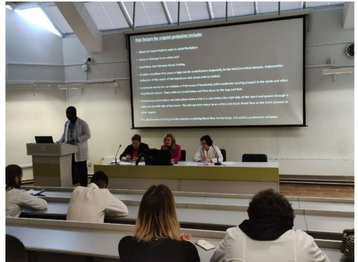
Работа жюри и участников секции