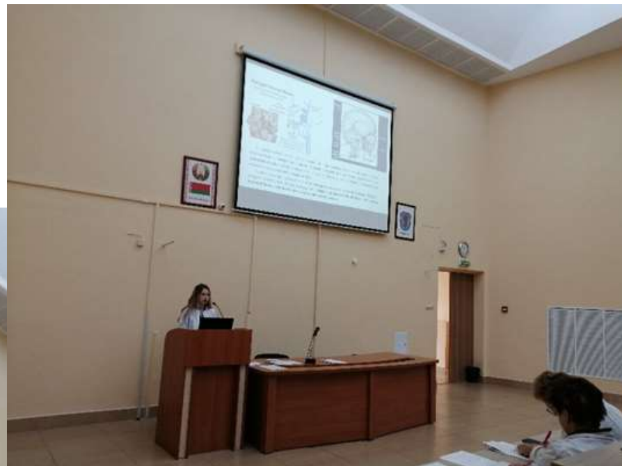
Кружковцы кафедры нормальной анатомии БГМУ со своими докладами