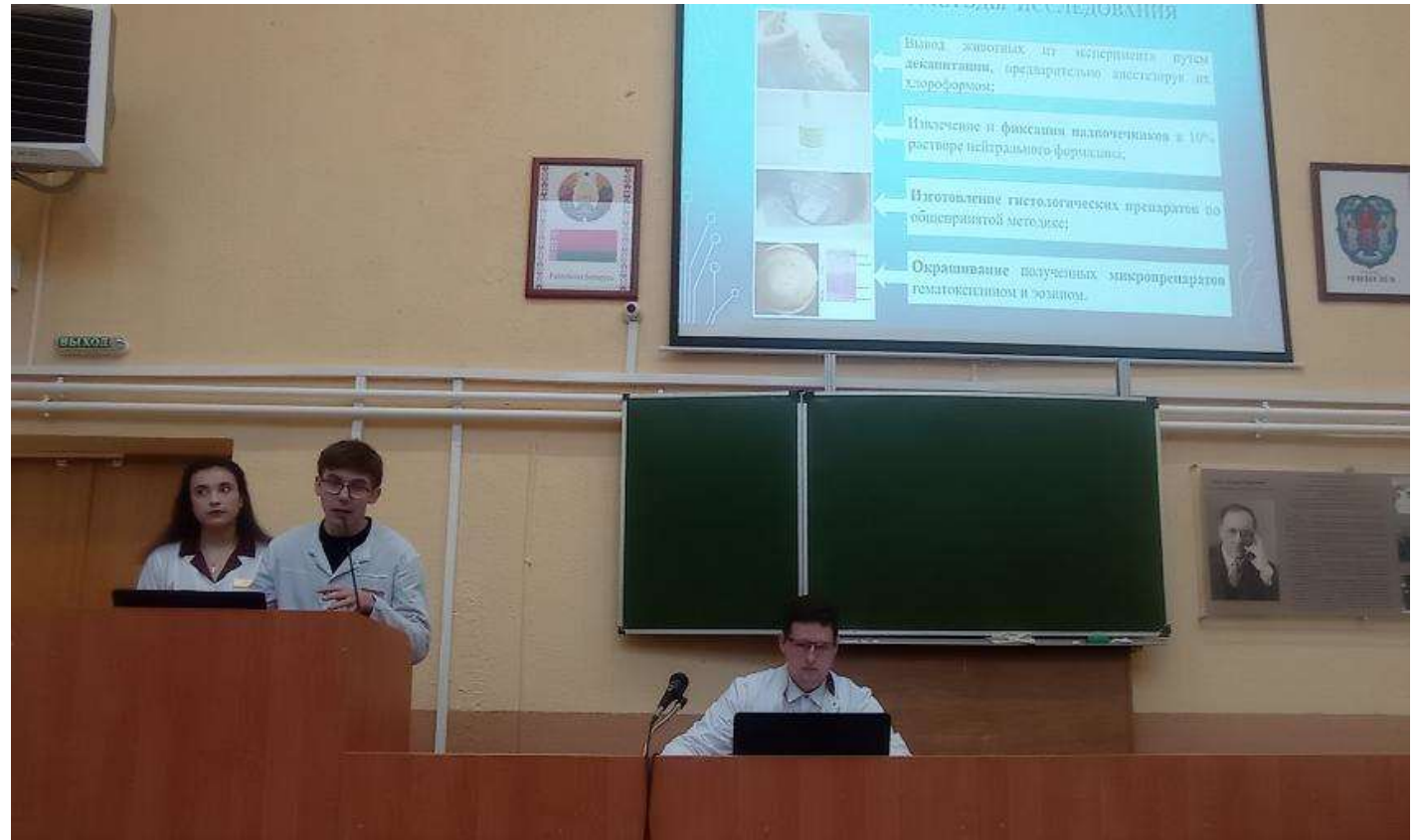
Выступление студентов из Великого Новгорода , Новгородский государственный университет им. Ярослава Мудрого