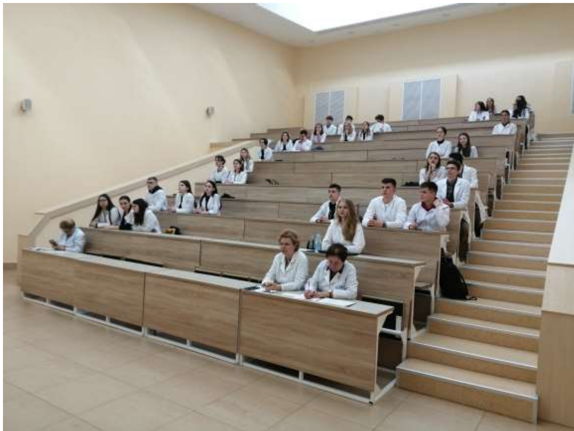
Жюри и участники 2-й секции