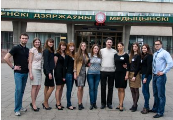
Республиканская олимпиада по педиатрии в г.Гродно, 2012г