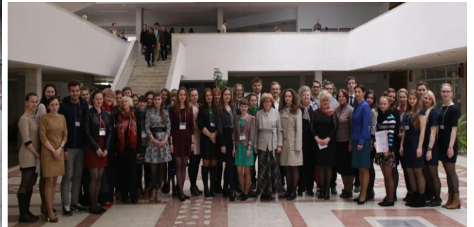
Республиканская олимпиада по педиатрии в БГМУ, 2016г