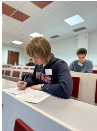
Верность традициям: внутривузовский этап Олимпиады по педиатрии, ноябрь 2023г.