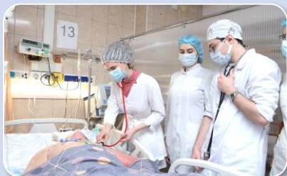
7-07-0911-01 «Лечебное дело»

В БГМУ осуществляется подготовка по специальностям: