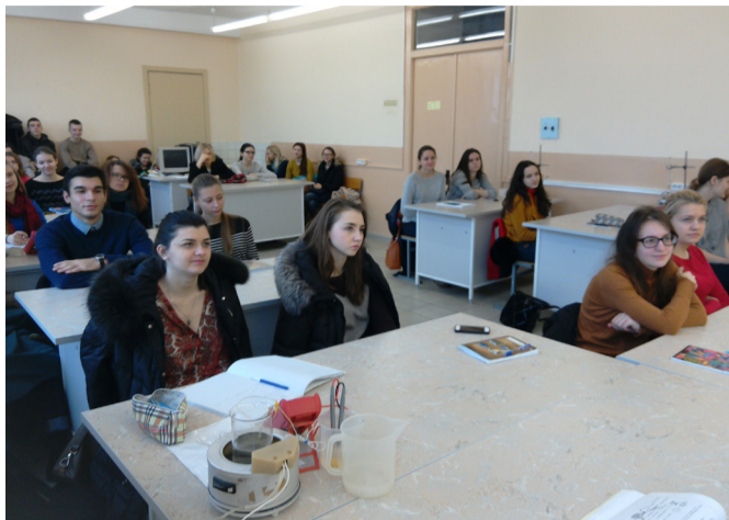
На фото: участники «Студпрофессора»

студенты, которые уже прошли все тяготы этих экзаменов, и могут поделиться как опытом, так и знаниями.