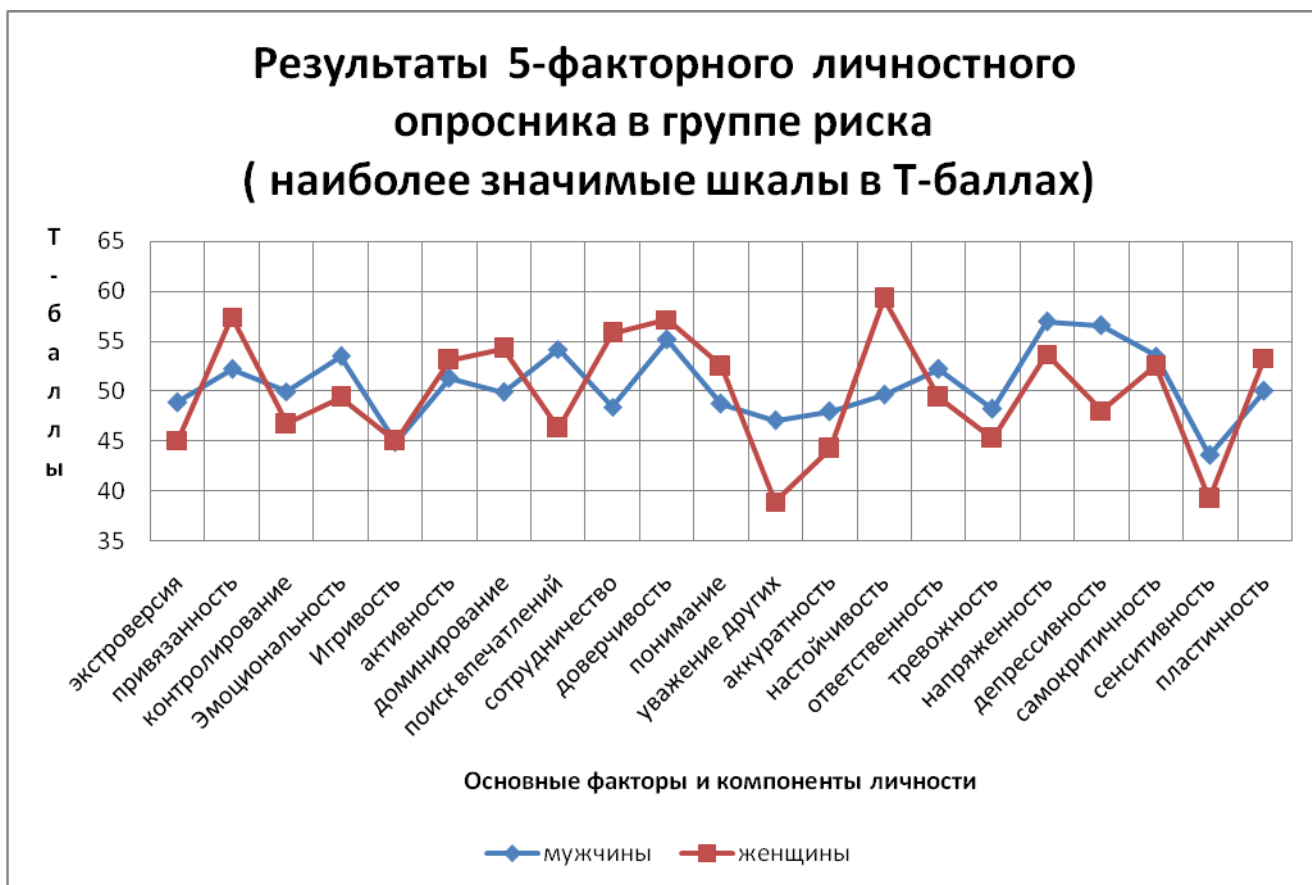
Рисунок 1 – Личностный профиль характерный для лиц из группы риска по алкогольной аддикции

необдуманным поступкам. Такие люди недобросовестно относятся к работе, не проявляя настойчивости в достижении цели. Они не прилагают достаточных усилий для выполнения принятых в обществе требований и культурных норм поведения, могут презрительно относиться к моральным ценностям, склонны совершать асоциальные поступки. Ради собственной выгоды они способны на нечестность и обман, живут одним днем, не заглядывая в свое будущее.