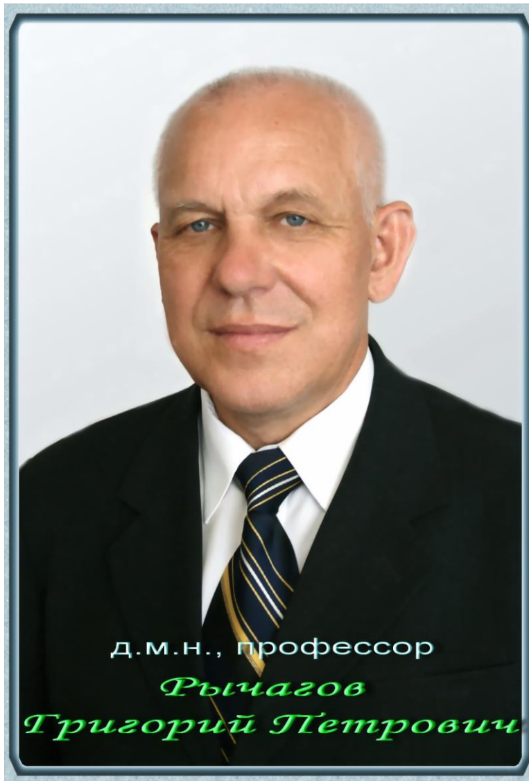
Рис 10. Заведующий кафедрой общей хирургии БГМУ в 1990-2009 гг. проф.