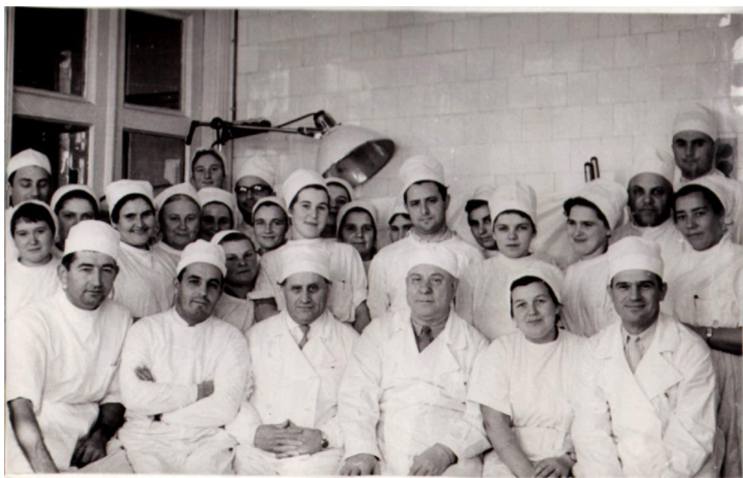
Рис. 5. С сотрудниками хирургической клиники (6.11. 1964 г.)