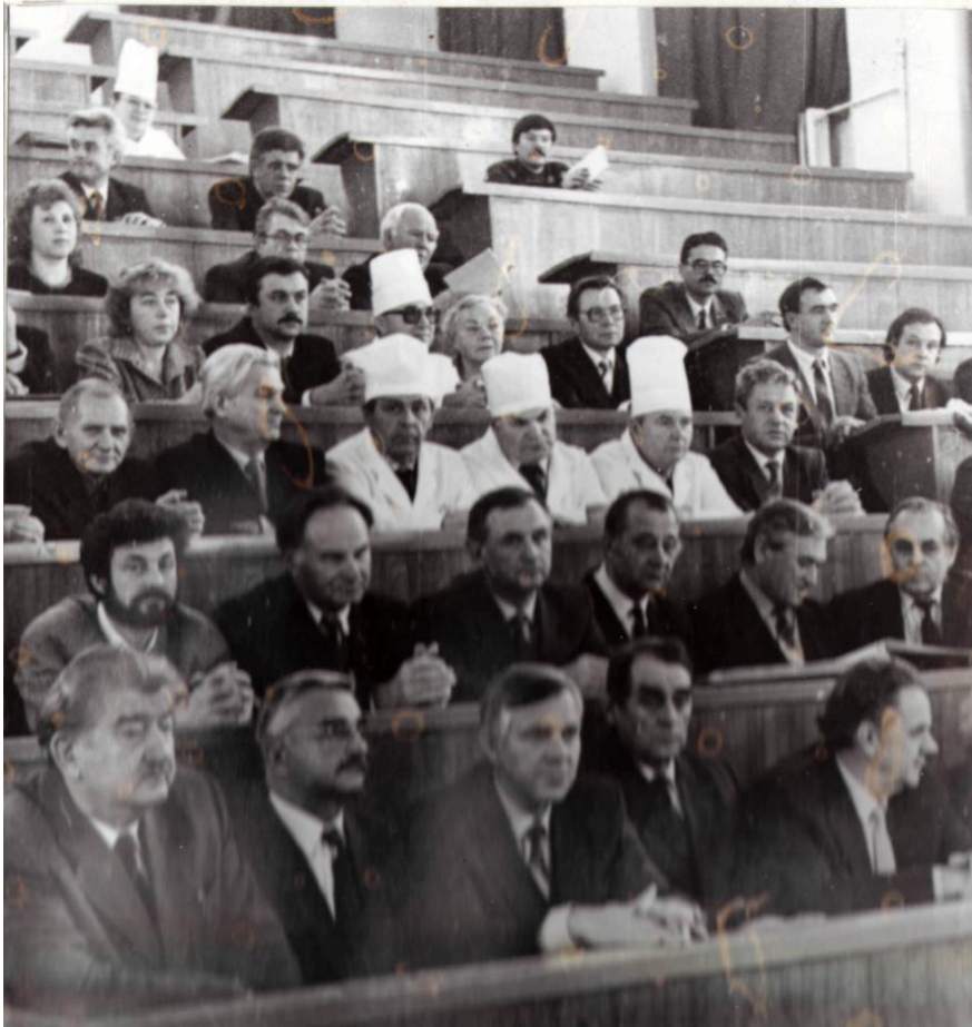
Рис 11. Заседание городского хирургического общества, посвященное 70-летию кафедры (г. Минск, 3 ГКБ 18.11.1992г.)