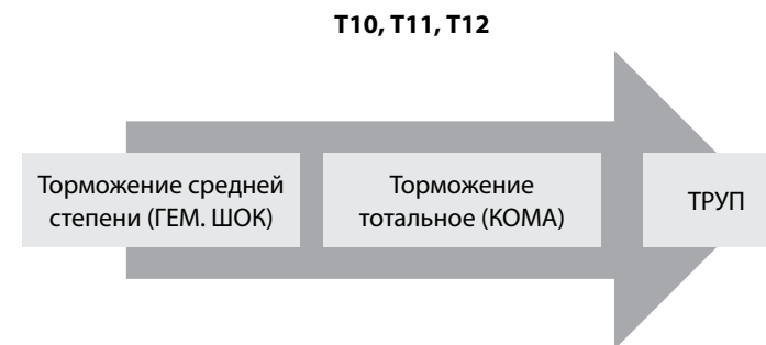
Рис. 3. Акушерская трагедия