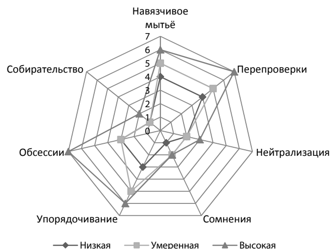
Рис. 2. Профили интенсивности навязчивых переживаний (OCI) с учетом степени выраженности (низкая, умеренная, высокая) фактора «общая астения» (MFI)

стоверны во всех случаях ( p < 0,03 ) кроме фактора «собираательство». В то же время умеренная степень физической астении связана с наибольшей интенсивностью обсессивно-компульсивных феноменов. На этом фоне как слабая, так и чрезмерная степень выраженности физической астении не сопутствуют значимым проявлениям обсессивно-компульсивной симптоматики.