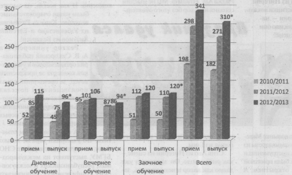
Прием и выпуск слушателей подготовительного отделения в 2010–2013 гг. Знаком * обозначен план выпуска по состоянию на 01.03.13 г.

Следует также отметить, что на протяжении многих лет в университете организована работа с учениками лицейских классов Минской области, которая предусматривает проведение лекций по наиболее сложным разделам программы средней школы. В настоящее время проводится работа с отделами образования районов Минской области по увеличению количества обучающихся школьников. Пер-