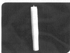
Рисунок 1. – Пластмассовый прикер для проведения прик-теста

Методика выполнения. Кожа предплечья обрабатывается 70%-м спиртом и после его высыхания на 5 см ниже локтевого сустава наносится одна капля раствора гистамина 0,01% – позитивный контроль, на 2 см ниже наносится капля растворяющей жидкости – негативный контроль, еще на 2 см ниже – раствор контрольного препарата (1% «Новокаин», 2% «Лидокаина гидрохлорид», 3% «Мепивакаин»). Если в анамнезе аллергическая реакция на препараты, содержащие в своем составе адреналин («Ультракаин», «Убистезин», «Септонест», «Артикаин-Боримед» и др.), кожные пробы необходимо проводить на каждый составляющий элемент по отдельности (4% артикаина гидрохлорид, бисульфит натрия, ЭДТА). Затем через капли специальными ланцетами (рис. 1) производится микропрокол кожи на глубину до 1 мм. Допускается плавный проворот ланцета на 180 градусов (ротационный прик-тест). Возможно тестирование до 5 препаратов. Результат оценивается через 15-20 минут. Сначала промокают невысохшие остатки жидкости отдельными для каждого аллергена ватными тампонами, затем измеряют волдырь и гиперемию. Результат прик-теста считается положительным, если диаметр волдыря \geq 3 мм при отрицательном тест-контроле и положительной реакции на гистамина гидрохлорид (10 мг/мл).