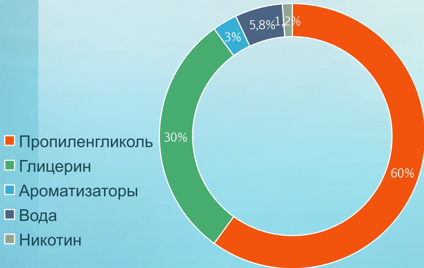
Диаграмма 1. Состав жидкости для электронных сигарет (жидкость с содержанием никотина 12 мг/мл)