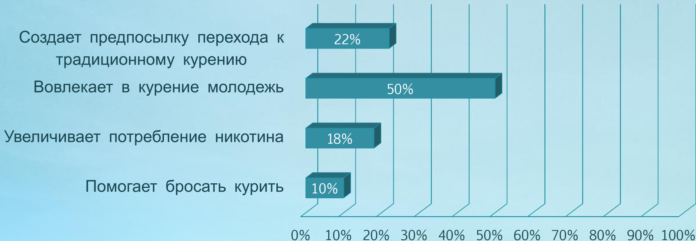
Диаграмма 2. Оценка отношения респондентов к использованию электронных сигарет

Наиболее значительная часть респондентов (50%) считает, что электронные сигареты вовлекают молодежь в курение. Высказывается опасение по поводу возможного перехода на традиционное курение впоследствии.