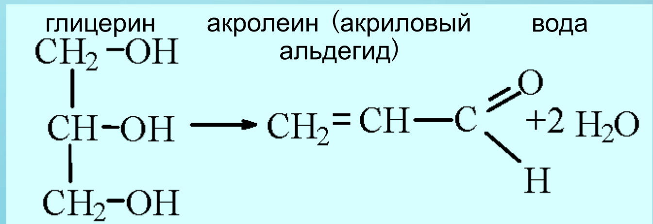
Рис. 2. Реакция образования акролеина