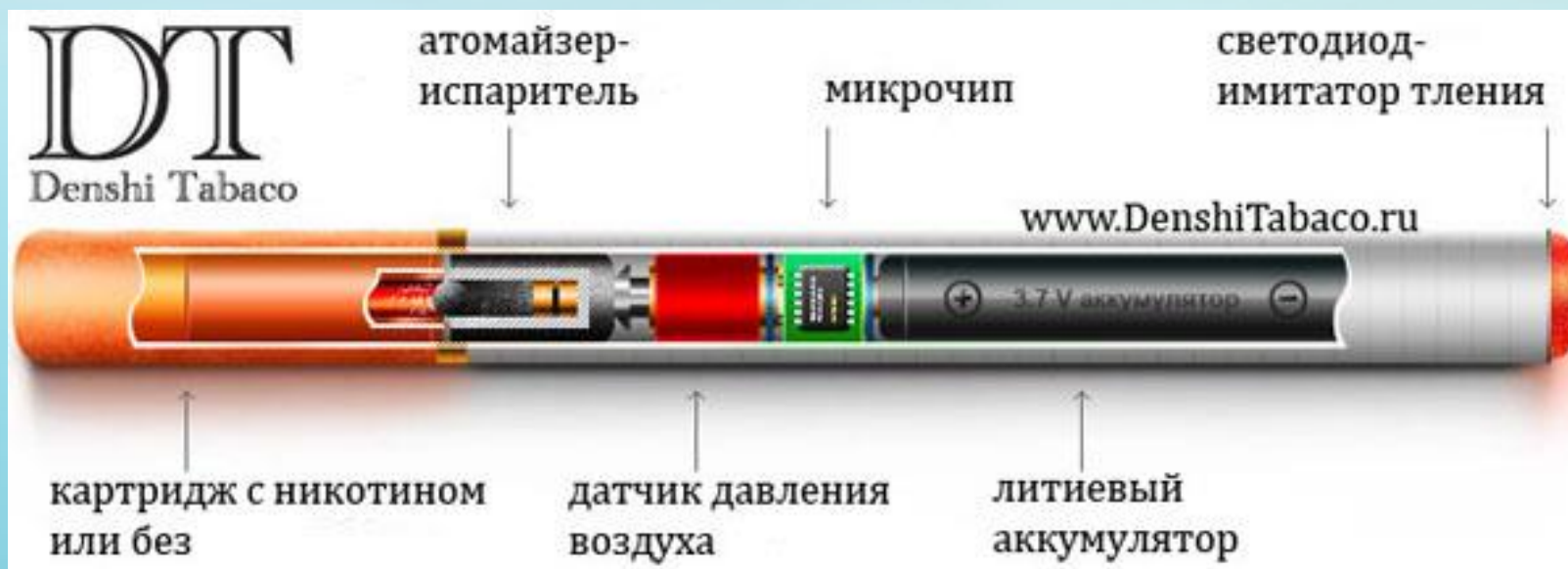
Рис. 1. Схема строения электронной сигареты

Электронная сигарета (англ. e-cigarette ) — электронное устройство, предназначенное для ингаляции (вдыхания) пара как с никотином, так и без него [1].