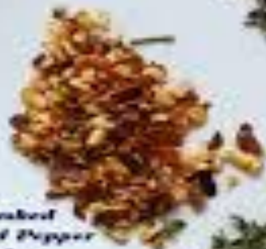
Crushed Red Pepper Flakes