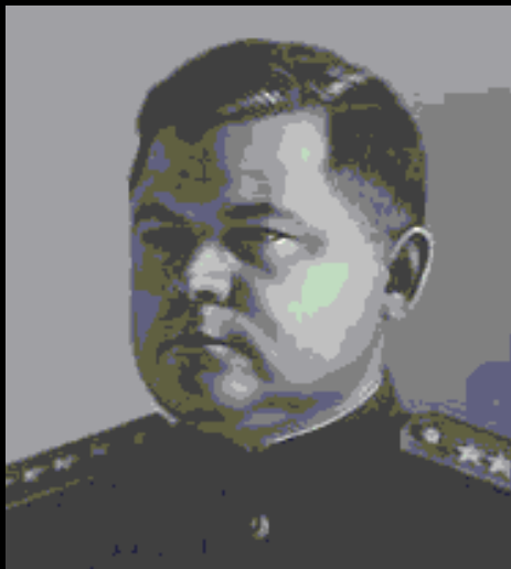
Н. Ф. Вату́тин.