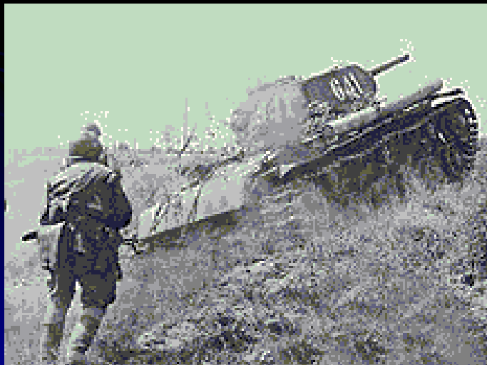
Пехота под прикрытием танка идет в атаку. 1943 год.