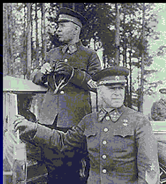
Г.К. Жуков и маршал С.К. Тимошенко