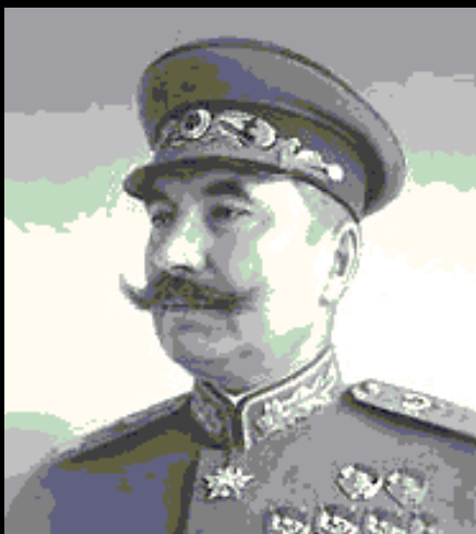
С. М. Буденный.