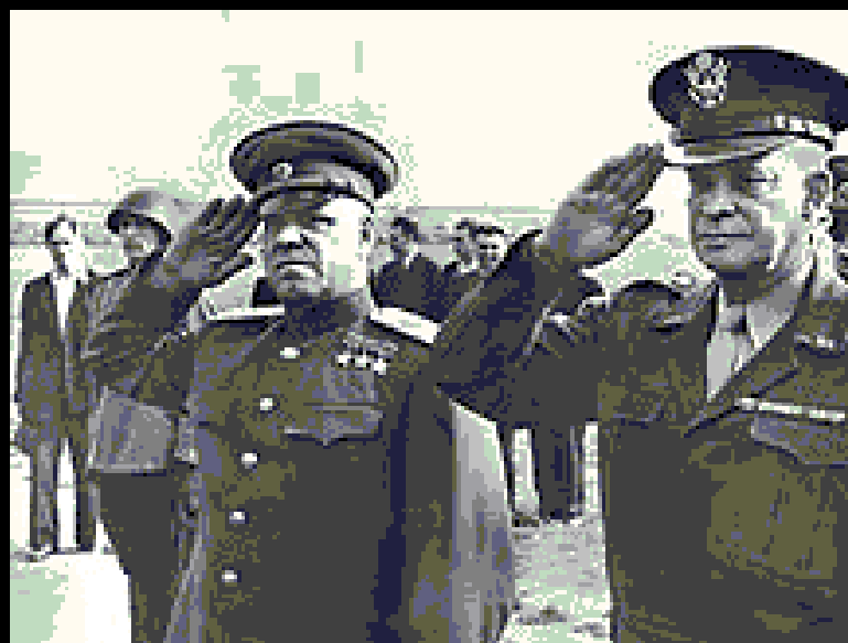
Г.К. Жуков и генерал Д. Эйзенхауэр