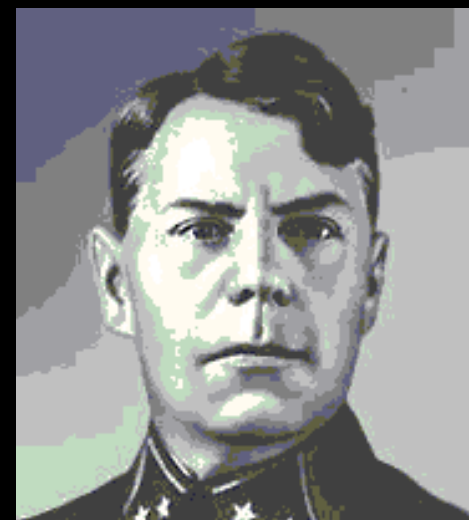
А. М. Василевский.