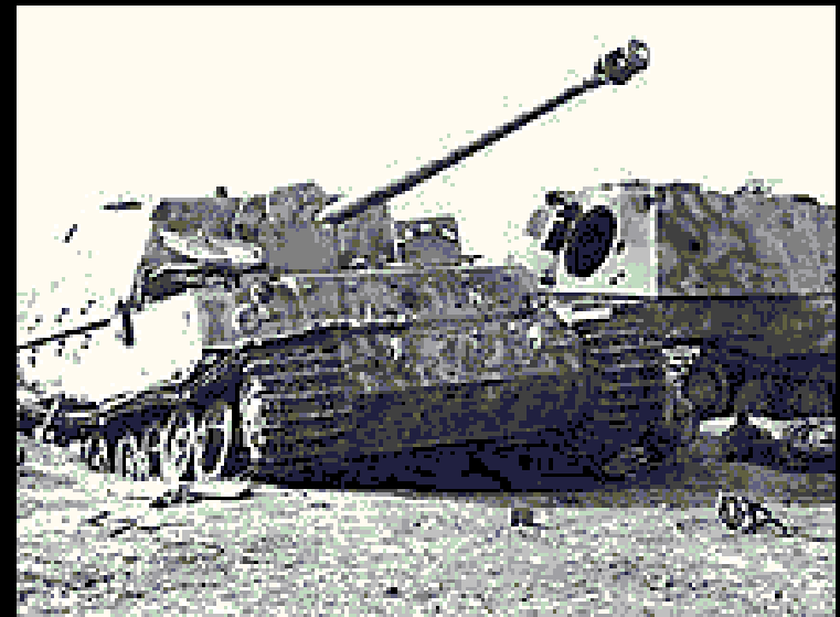
Подбитые немецкие самоходные установки «фердинанды». Курская дуга. Лето 1943 года.