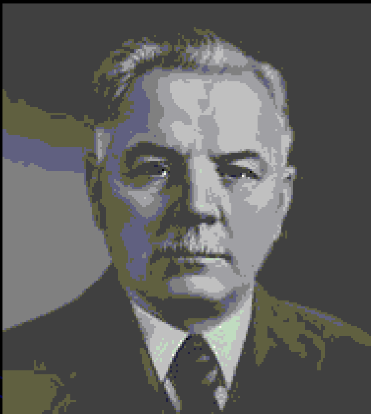
К. Е. Ворошилов.