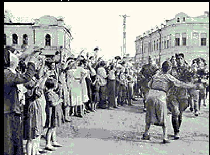
Жители Орла встречают воинов Красной Армии. 5 августа 1943 г.