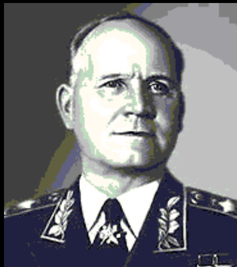
И. С. Ко́нев.