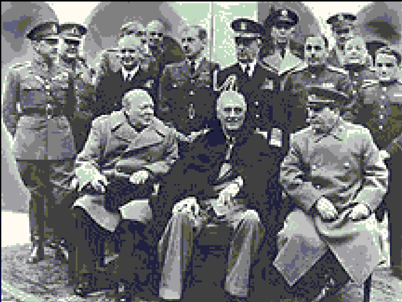
У. Черчилль, Ф. Рузвельт, И. Сталин на Ялтинской конференции. Ливадия, Крым. Февраль 1945 года.