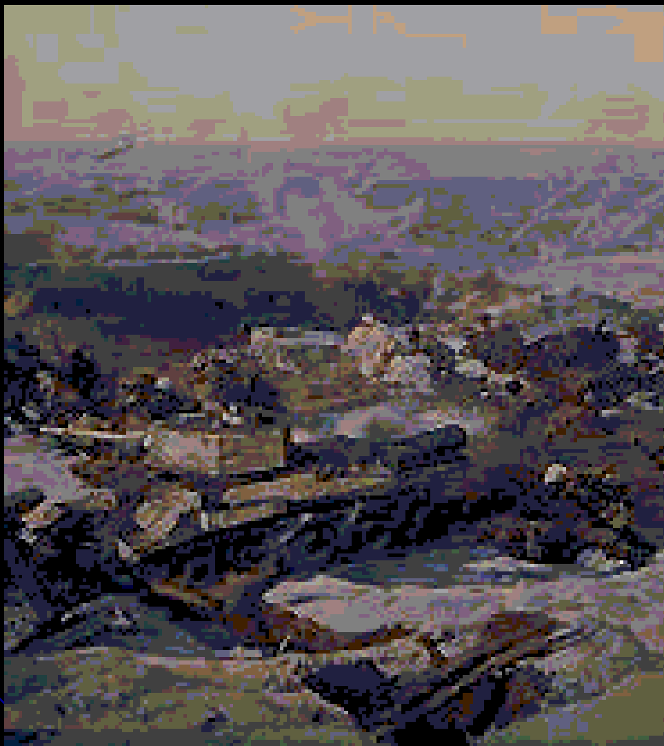
Фрагмент панорамы «Сталинградская битва». 1981. Н. Я. Бут, В. К. Дмитриевский и др.