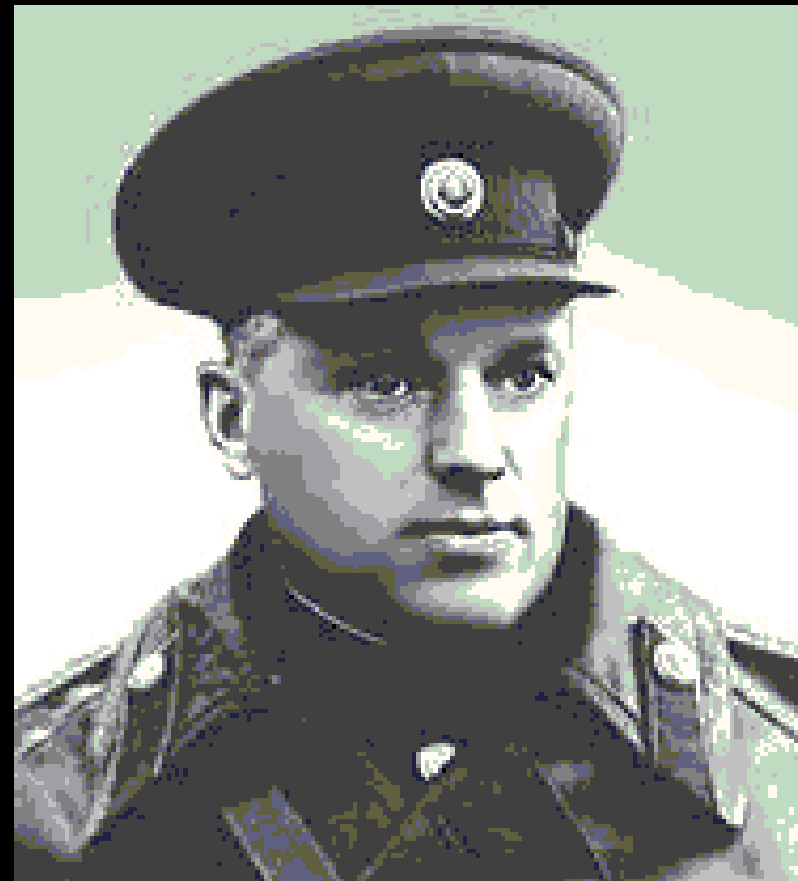
К. К. Рокоссовский.

В летне-осенней кампании 1943 решающим событием была Курская битва. Важную роль сыграли партизаны (операция «Рельсовая война»). В ходе битвы за Днепр было освобождено 38 тыс. населенных пунктов, в т. ч. 160 городов; с захватом стратегических плацдармов на Днепре созданы условия для наступления в Белоруссии. В битве за Днепр партизаны провели операцию «Концерт» по разрушению коммуникаций врага. На др. направлениях осуществлены Смоленская и Брянская наступательные операции. Красная Армия прошла с боями до 500-1300 км, разгромила 218 дивизий. Важным этапом в развитии международных и межсоюзнических отношений стала Тегеранская конференция (28 ноября — 1 декабря 1943).