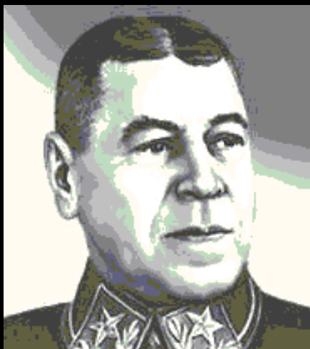
Б. М. Шапошников