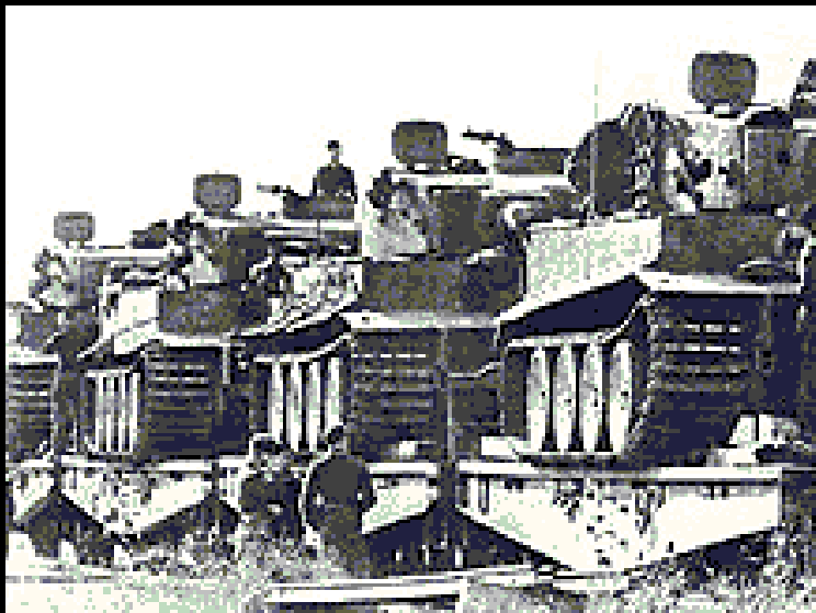
Переброска немецко-фашистских войск в район Курской дуги. 1943 г.