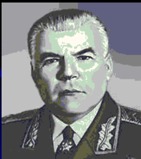
Р. Я. Малиновский.