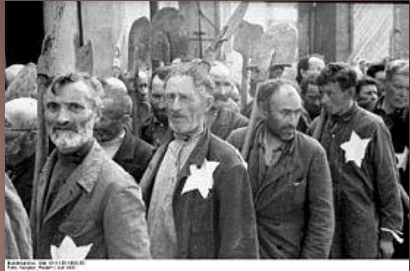
Juli 1941