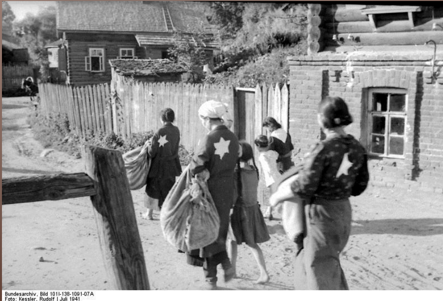
Juli 1941